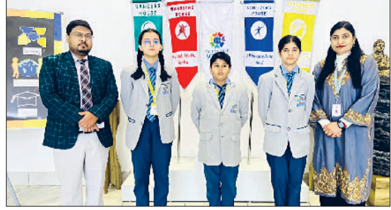
महम। खंड स्तरीय प्रश्नोत्तरी प्रतियोगिता के विजेता विद्यार्थी गुरुजनों के संग।