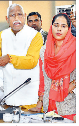
अपनी बात रखते अन्य पार्श्व।