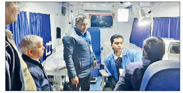
रोहतक। शिविर में आंखों की जांच करते डॉक्टर।

रोहतक। एएसईबी वर्कर्स यूनियन के राज्य कार्यकारिणी के आह्वान पर पूरे हरियाणा में बिजली कर्मचारियों ने ऑनलाइन ट्रांसफर पॉलिसी के विरोध में जोरदार प्रदर्शन किया। कर्मचारियों ने एडिशनल चीफ सेक्रेटरी उर्जा विभाग के नाम 14 सूत्रीय मांग पत्र सौंपा। रोहतक में सिटी, सांफला व सब अर्धन नंबर-1 डिवीजन में ज्ञापन दिए गए। यूनियन ने ऑनलाइन ट्रांसफर पॉलिसी वापस लेने, पुरानी पेशान लागू करने, रिस्क अलाउंस, केशलेस मेडिकलम व कचे कर्मचारियों को पक्का करने की मांग उठाई। यूनियन ने एक्सप्रेस बंद करने की आशंका जताते हुए नीति का कड़ा विरोध किया।