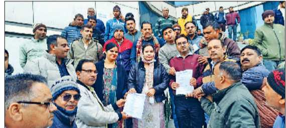
रोहतक। अपनी मांगों को लेकर प्रदर्शन करते एएसईबी वर्कर्स यूनियन के सदस्य।